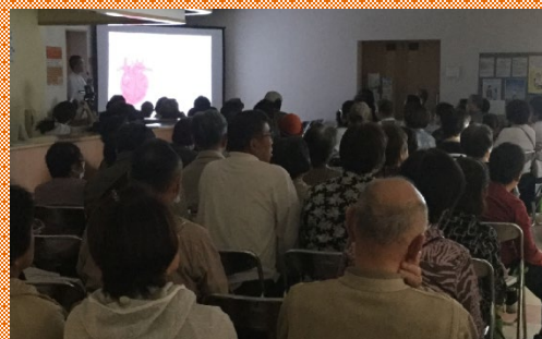
【実演】やってみよう、隠れ脳梗塞チェック

当日は89名と多数の方々にご参加いただき、ありがとうございました。 今回のセミナーでは、脳卒中・心筋梗塞の対処から身体の様々な症状に対し、どう対処すべきか紹介しました。 胸が痛いけど救急車を呼ぶべき？病院に行くべき？ 胸の症状1つでも心臓や肺や食道など色々な原因が考えられます。正しい対処で大切な命が救われ、後遺症も防ぐことができます。 参加した方からは「何かあっても対処法が分かったので安心だ」と緊急時の対応に自信をもってもらえました。 自分自身のみならず大切な人を守るためにも適切で迅速な処置は重要です。今後もセミナーを開催しますので当院の患者さんも地域の方々もご参加ください。